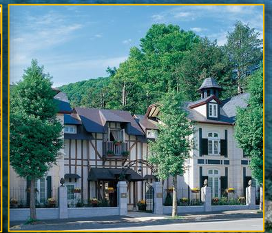
オーベルジュ・ド・リルサッポロ

北海道の農村漁業はこれから大きく進化します。北海道・地域社会は今、何をすることにより希望あるステージに向かえるか…。それと共に、積丹町でのジン造りの取り組み等をお話していただきます。